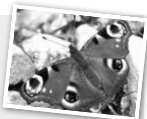
le paon du jour